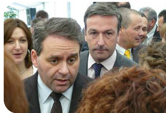
table ronde sur la prise en charge de la maladie d'Alzheimer en Eure-et-Loir. A Voves, il a rencontré les élus et les acteurs économiques du département, puis a visité l'entreprise Briand et Gérard où il s'est entretenu longuement avec son personnel sur les projets de vie de chacun et les conditions de travail.

Le 7 janvier, Xavier BERTRAND, Ministre du Travail, des Relations Sociales et de la Solidarité, nous a rendu visite à l'initiative de Philippe VIGIER. Il a visité les travaux d'extension de la résidence Texier-Gallas d'Orgères, assisté aux conclusions d'une