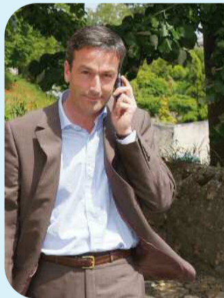
Philippe Vigier Député d'Eure-et-Loir